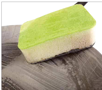
Der komplette Schwamm ist mit Seife versetzt