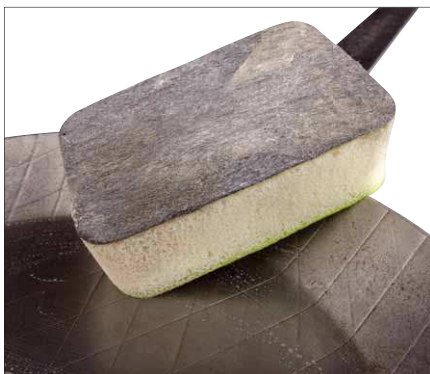
Wirkseite aus Stahlwolle