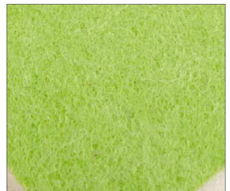
Wischseite aus Baumwoll-Zellulose-Mix