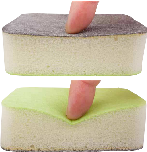
Die Stahlschicht ist vergleichsweise fest