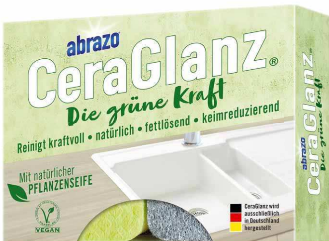
Auch bei der Verpackung setzt Abrazo auf nachhaltige Materialien

CeraGlanz Die grüne Kraft eignet sich für fast alle Oberflächen in der Küche. Arbeitsfläche, Ober- und Unterschränke, Kochfeld und Kochgeschirr sind damit schnell und mit geringem Aufwand wieder in strahlende Sauberkeit versetzt. Selbst hartnäckige Klebereste und Ein-gebranntes sind schnell und umwelt-schonend entfernt.